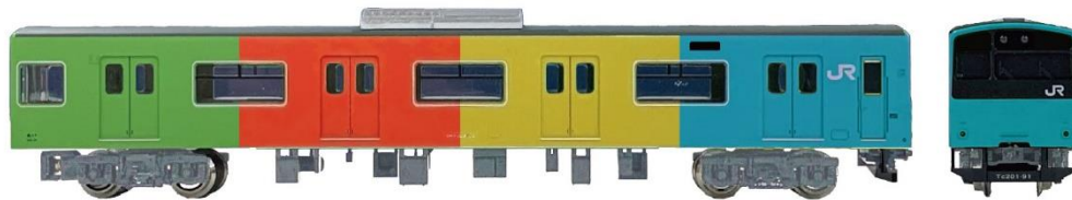
▲車両ラッピングイメージ

※5月17日(土)・18日(日)の見学には別途チケットが必要ですので、ご注意ください。