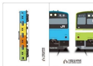
▲A4クリアファイル 400円(税込)

ミュージアムショップ お問い合わせ先：080-3461-5537 (毎営業日：10時～17時)