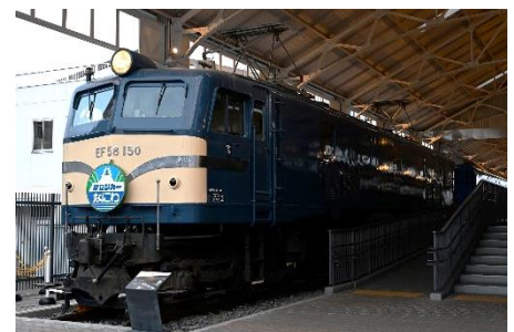
▲EF58形150号機 サロンカーなにわヘッドマーク(複製)