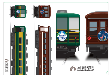
▲A4クリアファイル(裏表)

「サロンカーなにわ」特別展示期間中、株式会社日本旅行の協力により同社が所有する「サロンカーなにわ」ヘッドマーク(複製)を当館収蔵のEF58形電気機関車150号機に掲出します。