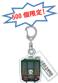
▲アクリルキーホルダー 850円(税込)