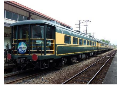
▲「サロンカーなにわ」

※営業路線を運転して搬入するため、輸送上の都合により展示を中止する場合があります。